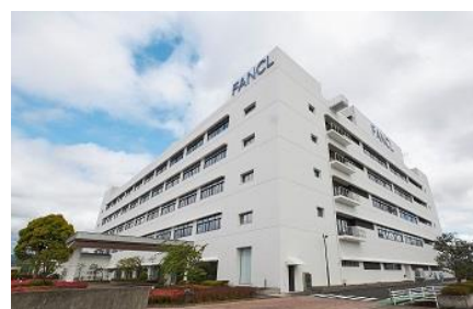
ファンケル美健 三島工場（外観）

キリングroup°は長期経営構想「キリングroup°ビジョン 2027（以下 KV2027）」を策定し、「食から医にわたる領域で価値を創造し、世界の CSV ※ 先進企業になる」ことを目指しています。その実現に向けて、既存事業の「食領域」（酒類・飲料事業）と「医領域」（医薬事業）に加え、キリングroup°が長年培ってきた高度な「発酵・バイオ」の技術をベースにして、人々の健康に貢献する「ヘルスサイエンス領域」（ヘルスサイエンス事業）の立ち上げ、育成を進めています。